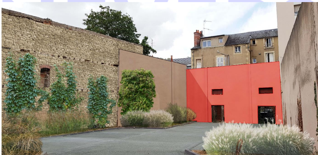
Visuel du mur 2 (en rouge) :